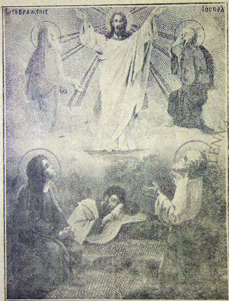
Θαβώρ καὶ Ἐριμών ἐν τῷ ὄρει σὺν ἀγγελοῖς

«Οὗτος ἐστὶν ὁ υἱός μου ὁ ἀγαπητός· αὐτοῦ ἀκούετε» (Λουκ. Θ. 35. Ματθ. 17 δ. Μαρκ. Θ. 8.)