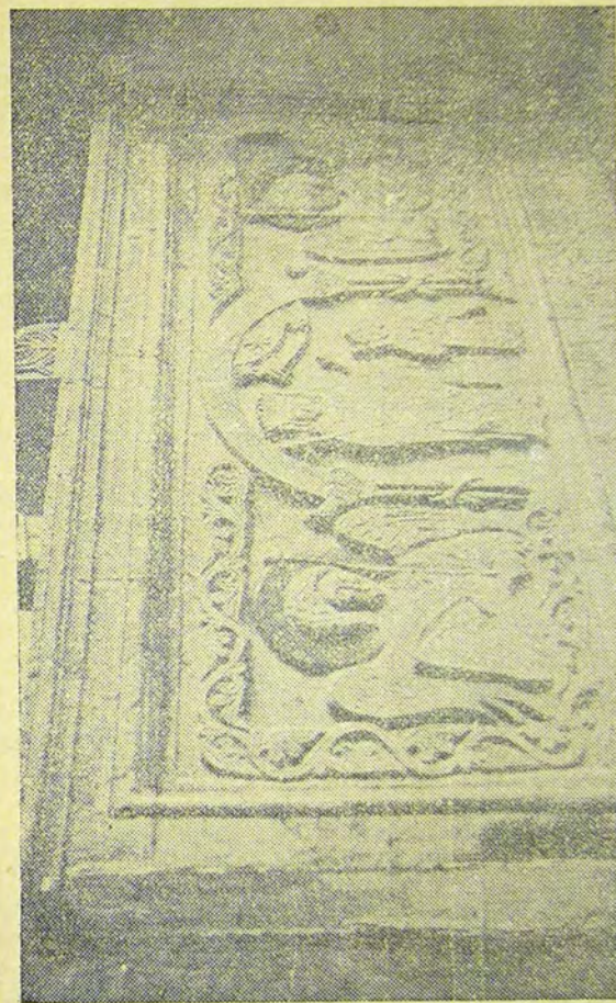
Τὸ γλυπτὸν τοῦ τάφου τῆς Ἁγίας Θεοδώρας.

Ε ν θαύμασιν ἀπείροις Βασιλῆς θεόφρον, ὁ παντοκράτωρ Θεὸς σὲ ἐδόξασε· τοῦτον θερμῶς ἐκδυσώπει ὑπὲρ τῆς ποιμένης σου.