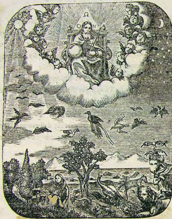
Ὁ Δημιουργὸς τοῦ παντός.