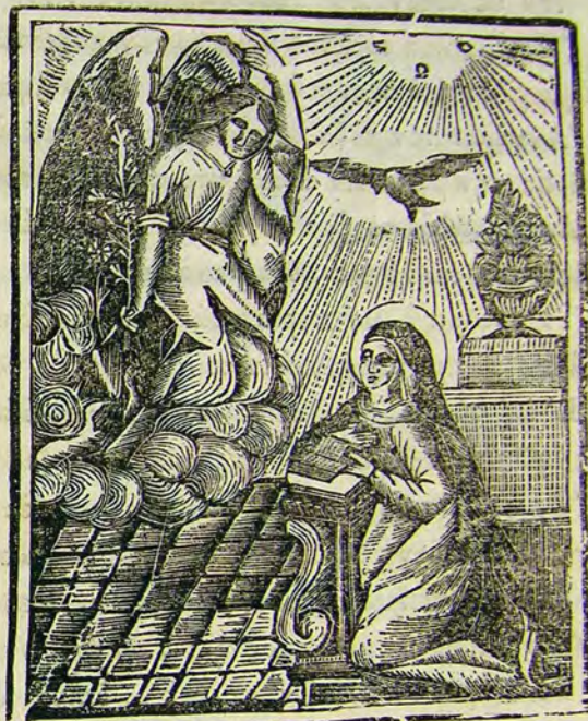
Ὁ Εὐαγγελισμὸς τῆς Θεοτόκου.

Τὸν ἀσπασμὸν ἐκόμισε, «Χαῖρε χαριτωμένη, Ἡ μεταξὺ τῶν γυναικῶν ὑπερευλογημένη». Θέλεις συλλάβει σὺ υἱόν, καὶ θέλεις αὐτὸν τέξει, Τὸ ὄνομα Ἐμμανουὴλ αὐτοῦ θέλεις καλέσει,