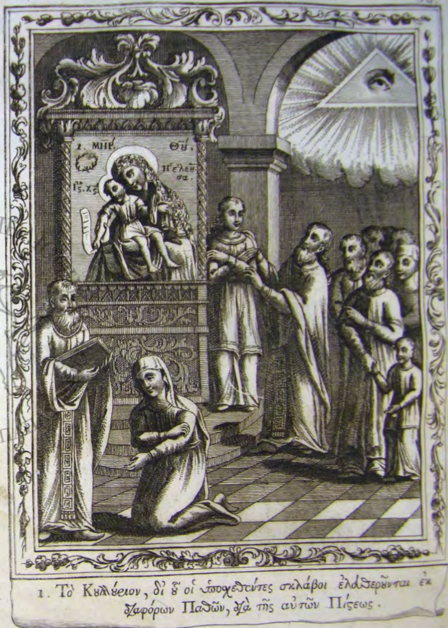
1. Τὸ Κολάειον, δι' ὃ οἱ ἐποχιδέντες σκλάβοι ἐλευθερύνται ἐκ τῶν Παδῶν, διὰ τῆς αὐτῶν Πίσεως.

Καὶ ὁ στρατοκόπος δὲ Γεώργιος συντείψας τὸν πόδα αὐτῷ κατὰ τὴν ὁδὸν, ἐντὸς ὀλίγων ἡμερῶν ὑγιὴς παρ' ἐλπίδα πᾶσαν ἀπέδεχθη. Φαίνεται καὶ χεῖρα τις σιδηρὰ, εἰς μνήμην τοῦ γενομένου πρὸς τινὰ Ἑθνικὸν Θαύματος. ἔτος γὰρ κινήσας τὴν χεῖρα κατὰ τῆς Ἁγίας Εἰκόνης, ἔλαβεν εὐθὺς τὴν παιδείαν τῆς χειρὸς αὐτῇ ἱερὰν δεικνύσης. ὁ δὲ καὶ πάντες φέιττεσιν οἱ Ἑθνικοὶ, Παναγίαν τοῦ Κυκκου ἀκρόντες. Καὶ Ἑθνικός τις, Σατράπης μέγας τῆς Νήσου, ἀκύνων περὶ τῆς Ἁγίας Θεομητορικῆς Εἰκόνης πολλὰ μὲν καὶ ἄλλα, καὶ ὅτι ἐνεργεῖ εἰς πᾶς αὐομβείας, αὐχμὺς τότε ἐν τῇ Νήτῳ ὄντος, διὰ παιδείαν ἥν κατοικούντων, ἐκάλεσε τὸν Ἠγέμενον, καὶ μετ' ἀπειλῆς εἶπε πρὸς αὐτόν· ἀκύνω πῶς πλωῶς τὸν Κόσμον καλόγερε μὲ εἰς σαρρέττι ἀπ' ἐχέως· ὅμως μετὰ ὀλίγας ἡμέρας ἤξευρε, αὐτίως καὶ δὲ γίνῃ βροχή, θέλω αὐτοῖς εἰς τὴν κεφαλὴν σου τὸ σουρέττι σε, (ἐννοῶντας τὴν Ἁγίαν Εἰκόνα,) καὶ ὑπερον νὰ σὲ θανατώσω. Ταῦτα ὁ Ἠγέμενος ἀκῆσας, ἠλθον εὐτρωμος εἰς τὴν Μοῆν, καὶ νησεύων ἐλιταύεε μετὰ τῆς Ἁγίας Εἰκόνης περιερχόμενος. ἦν δὲ ἐν Μυελανθῶσῃ ὅτε ἠγγικεν ἡ διωρεῖα, καὶ λοιπὸν δέόμενος τίπτει κατὰ γῆς ἔμφορσεν τῆς Ἱερᾶς Εἰκόνης, χύνων ποταμὸν δάκρυα, ὥς ὑγρὰ θῆναι τὸ ἔδαφος, καὶ εὐθὺς, ὡς τῆς ἐν τῇ Χαλειτοβρύτῳ Εἰκόνι σε μεγάλης Χαρίτος Ὑπέρραγνε Δέσποινα! νέφος μικρὸν ἐφάνη περὶ τὸ μέσον τοῦ Οὐρανοῦ, καὶ σκό-