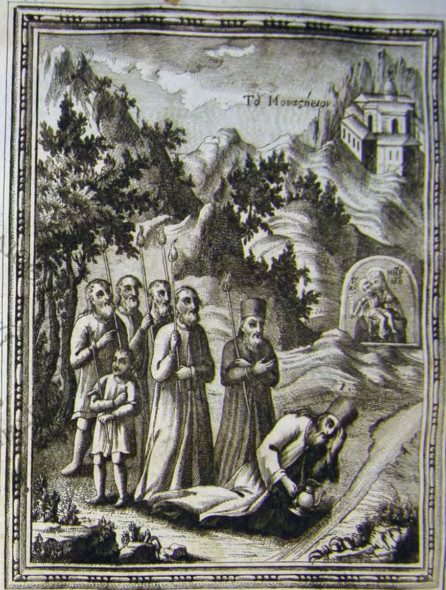
Οἱ Προσερχόμενοι τῷ Ἀγιάσματι τῆς Θεοτόκης, καὶ θαυμάτων ἀδυνειῶν ἀπαλαττόμενοι.

Ἐτι ἀφῶν νὰ λέγω καὶ τὴν Μονὴν καλεσμένην, καὶ ἐπιλεγομένην, ἐκ οἷα ὅπως, τῶν Ἱερέων, ὡς ἐν αὐτῇ καθοράται γεγραμμένον, ἡ Μονὴ τῶν Ἱερέων, διάσημον τὸ πάλαι Μοναστήριον, καὶ ἀρχαῖον, ὡς