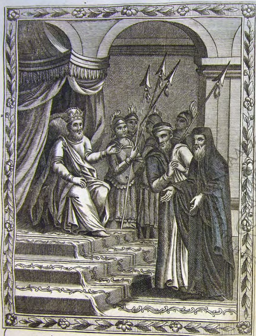
Ὁ Δὲξ αὐτὰ παρὰ τῷ Βασιλεῖ τῷ Ἀγίῳ Εἰκόνα.

Ταῦτα ἀκούσας ὁ Βασιλεὺς, ἔμεινε περὶλυτος, πλὴν ὑπέχετο ἐὰν ἰαθῇ ἡ Ουγατὴρ αὐτῆς, τῷτο ποιῆσαι, μάλιστα δὲ καὶ μετὰ δακρύων ἐκραξεν· „εἰ τῷτο ἐστὶ σὸν δέλημα, Θεοτόκε Παρθένε, τίς εἰμὶ ἐγὼ „ὁ εὐπλής τοῦ ἐναντιωθῆναι τῇ σῇ βελῇ, Κυρία μου Δέσποινα; πλὴν „τῷτο δέομαι ἐξ ὅλης μου τῆς ψυχῆς, ἵνα λυτρώσῃς τὴν Κόρην μου „ἐκ τῆς αἰατῆς καὶ δεινῆς ἀδελφείας, καὶ πάντως ἀποσείλω ἐτίμως τὴν „ἐν τῷ Παλατίῳ μου Σειττὴν Εἰκόνα σου ἐν τῇ Νήτῳ Κύτρω.“ Ταῦ- τα