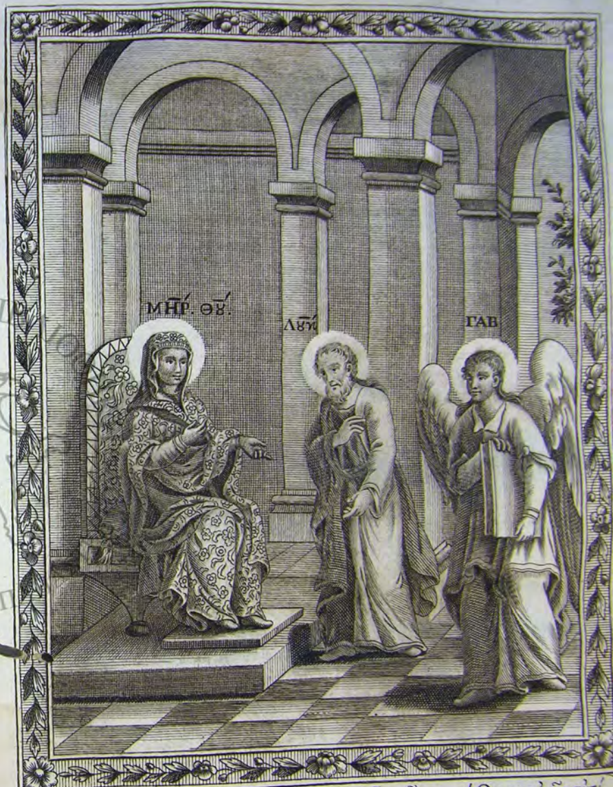
Ἡ Θεοτόκος καὶ ἱερὸν Λεκά, ὡς ἀγγέλλει, ἰσορῶσαι τὸ Θεῶν αὐτῆς ἀντί- τυπον. Ἀλλ' εἰς δὲ αὐτῆς Τρεῖς Σανίδες κηρύττει, καὶ τὸν Συγγραφεῖα.

Δὲν εἶναι ἀμφισβητούμενον εἰς τὰς Ὁρθόδοξας καὶ προσκυνητὰς τῆς Ἀγίας Εἰκόνας, πῶς εἶναι τὸτο ἔργον Θεῶν, ἡ τιμητικὴ λέγω τῆς Εἰκόνων προσκυνησις, παραδεδομένη ὑπὸ τῆς Θεῶν Ἀποστόλων, καὶ αὐτῶν τῶν Κυρίων ἡμῶν Ἰησοῦ Χριστοῦ. ἐπειδὴ πρῶτος αὐτὸς τὸ ἔχον τὸ ἐαυτοῦ ἐκτύπωμα ἱερὸν Μανδήλιον πρὸς Αὐγαρον ἐπέμψεν, καθὼς ἐν τῇ περὶ Εἰκόνων ἀρχαίᾳ Λόγῳ τῷ Δαμασκηνῷ ἐμφέρεται αὐτοῖς ρήμασι. „λόγος αὐτῶν εἰς ἡμᾶς παραδεδομένος κατέστιν, Αὐγαρον „τὸν Ἐδέοις Ἀνακτα φημί, τῇ τῷ Κυρίῳ πρὸς Θεῶν ἐκπυρσευθέν- „τα ἔρωτα ἀκοῇ, ἀποσταλκεῖναι Πρέσβεις τὴν ἐαυτῶν ἐξαιτῶντας ἐ- „πίσκεψιν. εἰ δὲ ἀρνηθεῖν τὸτο δράσειν, τὸ τότε κελεύει ὁμοίωμα „ζωγράφῳ ἐκμάζασθαι. ὁ γινώσκων τὸν πάντα εἰδότη, καὶ πάντα ду- „νάμενον, τὸ ράκος εἰληγεῖται, καὶ τῷ Προσώπῳ προσευεγκάμενον, „ἐν τῷ τῶν οἰκείων ἐναπομόρξασθαι Χαρακτῆρα, ὃς καὶ μέχρι τῶ „νῦν σώζεται“. Καὶ ὁ ἱερὸς δὲ καὶ Θεῶν Ἀπόστολος Λεκάς ἰσόρησε αὐτῆς προσάγειν, καὶ τῆς Κορυφαίων Ἀποστόλων, καθὼς δέχεται τὸτο ἔχει μόνον ἀπὸ τὸν βίον τε, ἀλλὰ καὶ ἀπὸ τὸν Θεῶν Δαμασκηνόν, καὶ ἀπὸ ἄλλων μεταγενεστέρων. Συμπεραίνεται δὲ αὐτὸ καὶ ἀπὸ ἄλλων τι- νῶν, καὶ μάλιστα ἀπὸ τῶν ὑπόμνημα τῶ μεταφραστῆ Συμεῶνος, ὅπως κά- μνει εἰς τὸν Εὐαγγελιστὴν Λεκά, εὐδα καὶ λέγει περὶ αὐτοῦ. „ὁ δὲ „τῆς