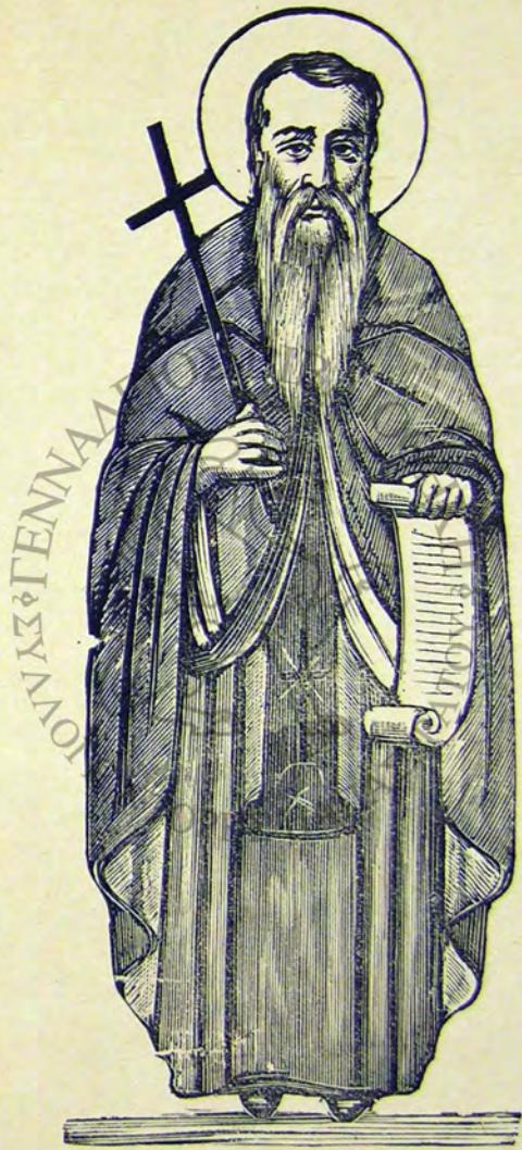
Ὁ ἅγιος Ἰσίδωρος ὁ Πηλουσιώτης