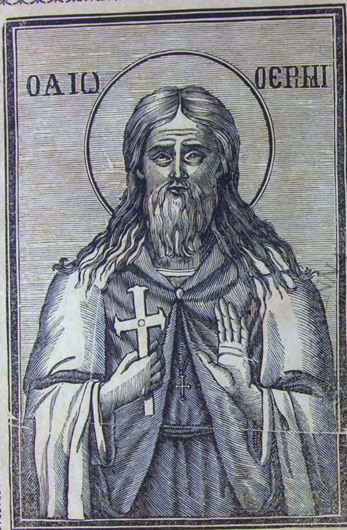
Ο ΑΓΙΟΣ ΙΩΑΝΝΗΣ Ο ΕΡΗΜΙΤΗΣ, Ο ΕΝ ΤΗ ΝΗΣΩ ΚΡΗΤΗ ΑΣΚΗΣΑΣ.

Τὴν θείαν σου μάκαρ εἰκόνα προσκυνούμεν εἰς τύπον τῆς μορφῆς σου.